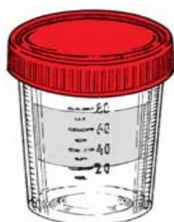
VZORKOVNICE / KONTEJNER NA ORGÁNY

Odebrané vzorky vložte a uzavřete do nepropustného obalu (zipový sáček), případně označte.