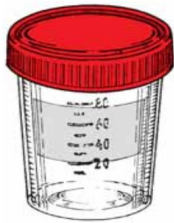
VZORKOVNICE / KONTEJNER NA ORGÁNY