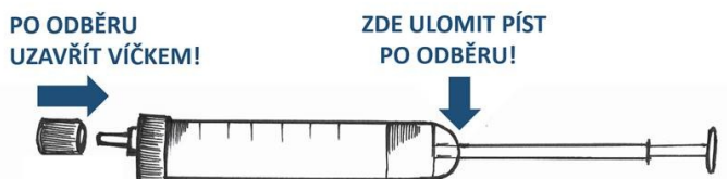
STŘÍKAČKA NA BARVU / KREV